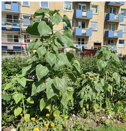
Den i särklass största solrosen 2021 odlades av Ville i uppgång nummer 3.

En container kommer att finnas på plats från och med 21 april. Elektronik får inte slängas i containern. Gårdsdagen avslutas med förstärkt fika.