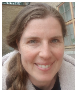
Ulrika Krave Uppgång 27